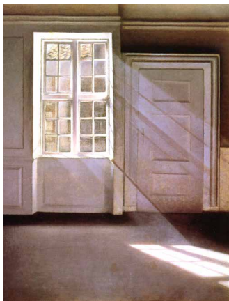
Hammershøi im Ordrupgaard Museum