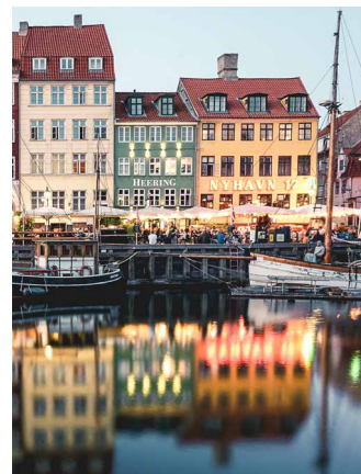
Am Nyhavn liegt auch unser Hotel

K openhagen ist eine kleine Grossstadt. Der Kaufleute-Hafen hat königlichen Charme erhalten. Heute geht das urbane Feld in neue Dimensionen über. Die dänische Metropole setzt auf eine überaus spannende Museumslandschaft und kann erlebnisreiche Wohnviertel vorweisen. Design und Daseinslust werden hier Geschwister.